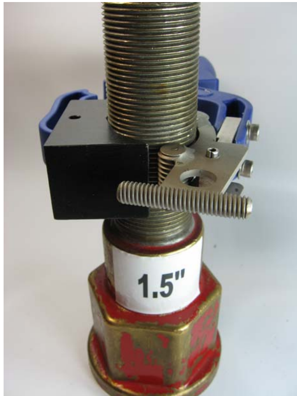
Adaptateur fermé sur une traversée