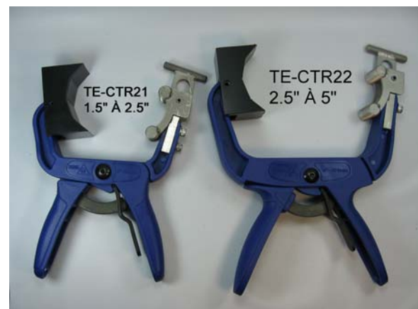
Deux modèles disponibles selon la dimension des traversées

Bloc de support en acétal ultra robuste.