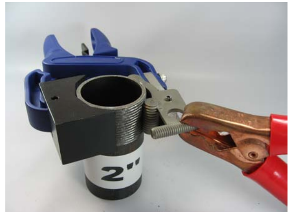
Utilisation des câbles standards sur les adaptateurs TE-CTR2x