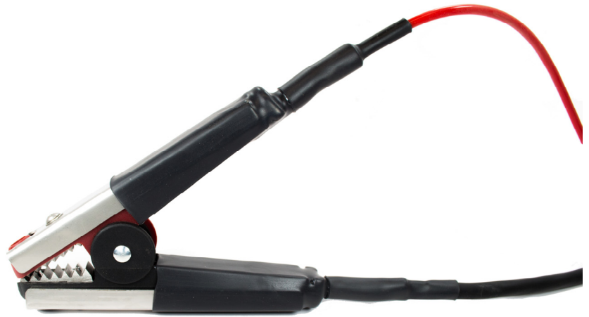
Pince Kelvin TEQAL à mâchoires courtes