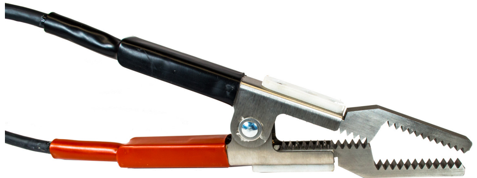
Pince Kelvin TEQAL TE-KL